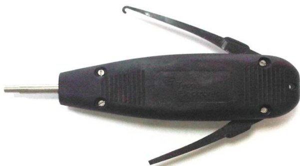
HERRAMIENTA QDF-888 (varilla normal)

Longitud varilla: 29 mm. Longitud total: 151 mm.